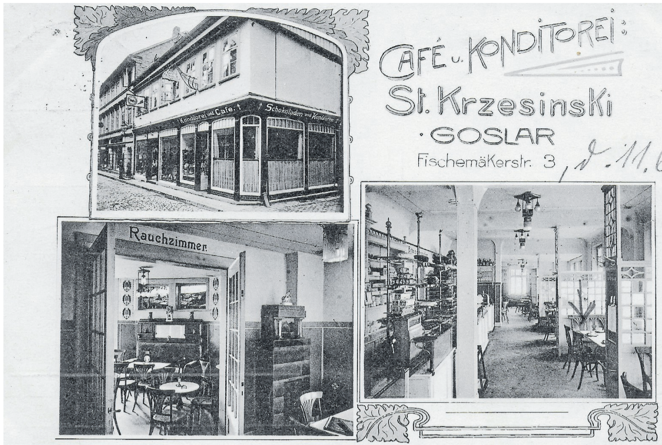
Eine Postkarte erinnert an das Café Krzesinski in Goslar.